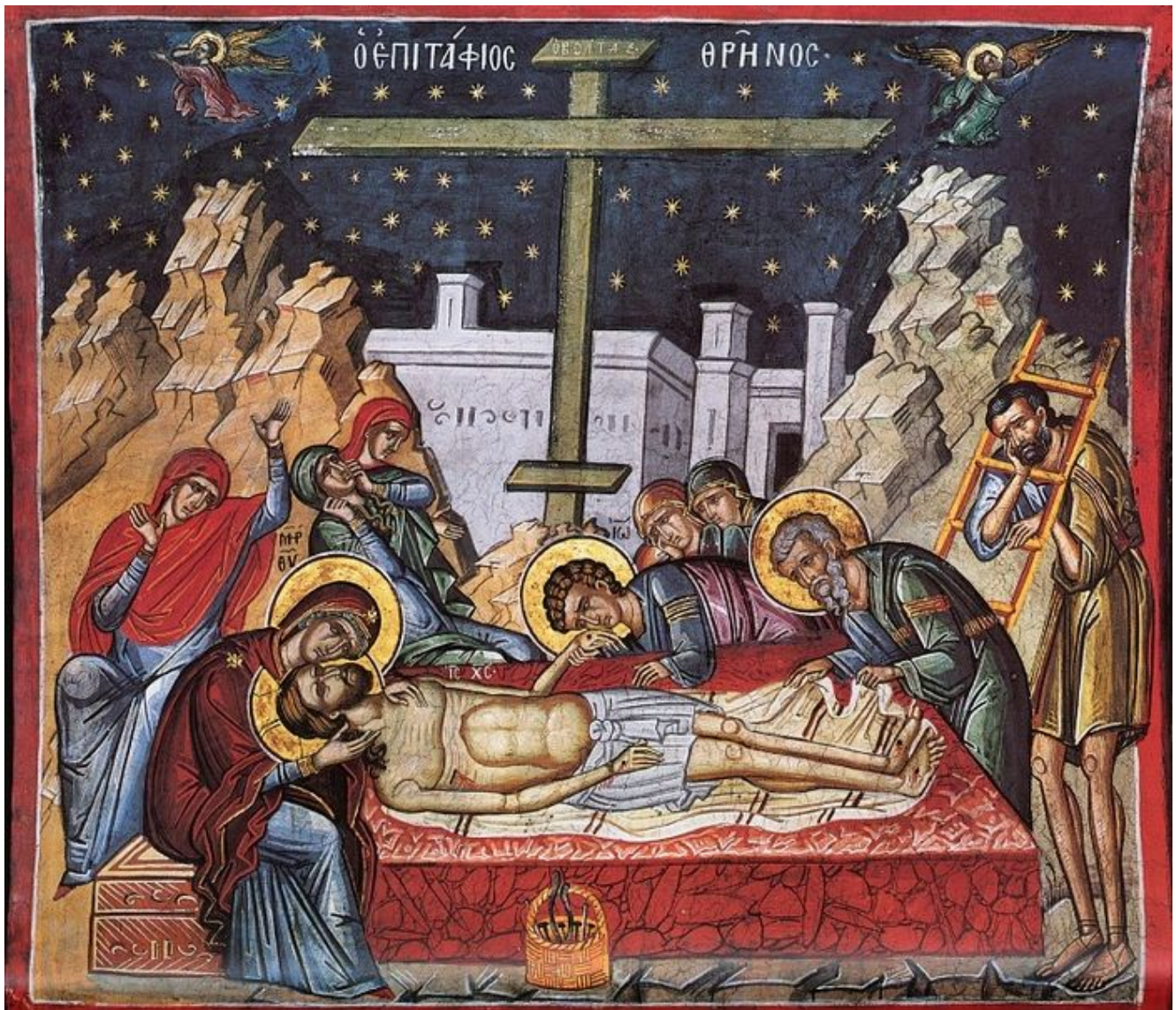
Великая Пятница. Оплакивание Христа. Фреска монастыря Дионисиат, Афон. Сер. XVI в.

Озарившись созерцанием великого события, возвратимся, возлюбленные братья, в дома наши, и унесем с собою глубокие, спасительные думы, ударяя этими думами в сердца наши. Мы воспоминали, мы живо созерцали деяние Божественной Любви, деяние, превысшее слова, превысшее постижения. На эту любовь мученики отозвались потоками крови своей, которую они пролили, как воду; на эту Любовь отозвались преподобные умерщвлением плоти со страстями и похотями; на эту Любовь отозвались многие грешники потоками слез, сердечными воздыханиями, исповеданием своих согрешений, и почерпнули из нее исцеление душам; на эту Любовь отозвались многие угнетенные скорбями и болезнями, и эта любовь растворила скорби их Божественным утешением.