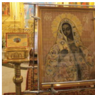
Чудотворная Калужская икона Божией Матери