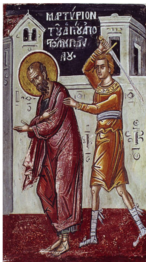
Мученическая смерть апостола Павла

Тогда святого Павла и его спутников вместе с конвоем посадили на корабль, и они поплыли сначала в Миры Ликийские, где пересели на корабль, отправлявшийся в Италию. С большим трудом они добрались до южной оконечности Крита, но не хотели зимовать там и, невзирая на предостережения святого, снова отправились в путь. Вскоре корабль попал в сильную бурю. Спутники Павла потеряли всякую надежду на спасение. Но апостол рассказал им о явлении ангела, возвестившего, что Господь дарует жизнь ему и всем плывущим с ним, ибо он должен прибыть в Рим.