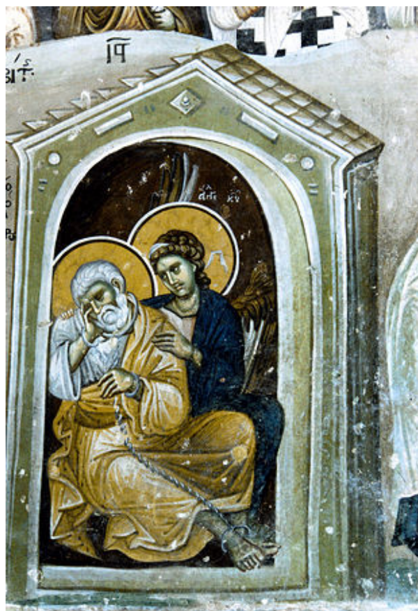
Апостол Петр в темнице

Когда царь Ирод Агриппа убил святого Иакова, брата Иоанна (см.: Деян. 12: 1–3), он приказал также взять и Петра. Его посадили в темницу и заковали в цепи. Петр должен был предстать перед судом, но накануне ночью, когда он спал, явился ангел Господень и наполнил темницу сиянием. Он прикоснулся к Петру – и цепи упали с его рук (память об этом 16 января). Следуя велению ангела, Петр оделся, вышел из дверей, которые открылись сами собой, и пришел в дом матери Марка, где собрались верующие и молились.