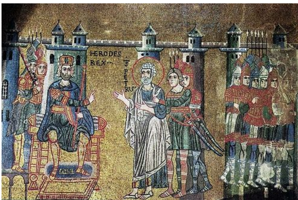
Апостол Петр перед Иродом

Затем апостол пошел в Лидду и исцелил расслабленного по имени Эней, а в Иоппии воскресил Тавифу. Когда он гостил там несколько дней в доме Симона-кожевника, ему трижды было видение. В нем Господь повелевал употреблять в пищу всяких животных, не делая предписанного Законом различия между чистыми и нечистыми.