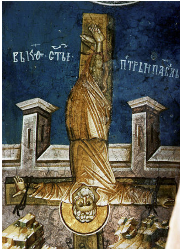
Распятие апостола Петра

После этого апостол Петр был в Иерусалиме и присутствовал при Успении Богородицы. Затем, вернувшись в Рим, он укреплял верующих этого города. По некоторым сведениям, Петр завершил апостольские труды в Милане или даже добрался до Британии[8].