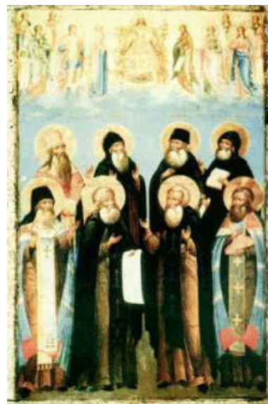
Собор Радонежских святых

Собор Радонежских святых – праздник Русской Православной Церкви, установленный в память святых сродников, учеников и собеседников преподобного Сергия Радонежского, а также святых иноков Троице-Сергиевой обители.