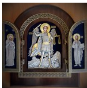
Икона Архистратига Михаила