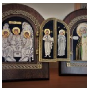
Иконы Живоначальной Троицы и преподобного Серафима, Саровского чудотворца