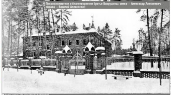
Сиротский приют имени братьев Бахрушиных, 1904-1905 годы

— Кроме наук, они обучались в мастерских электротехническому делу. Уже в младших классах умели пилить, строгать, могли выточить разводной ключ, со-