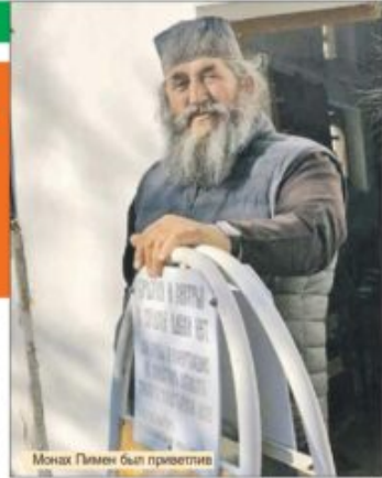
Монах Пимен был приветлив

А ещё рассказал, как 23 марта 1942 года фашистские