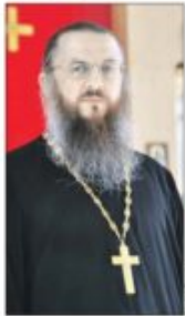
Старших селили с младшими