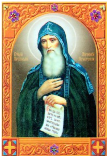
Преподобный Антоний Киево-Печерский

Преподобный Антоний Киево-Печерский родился в 983 году недалеко от Чернигова, в местечке Любече. С юных лет имея страх Божий, он желал облечься в иноческий образ. Придя в возраст, он отправился странствовать и, достигнув Афона, возгорелся желанием подражать подвигам его святых насельников. Приняв здесь постриг, юный инок во всем благоугождал Богу и, подвизаясь на пути добродетели, особенно преуспевал в покорности и послушании, так что все монахи радовались, глядя на его святую жизнь.