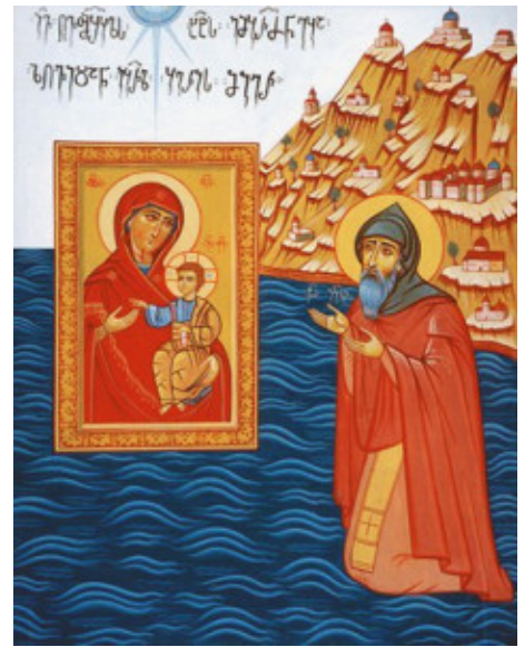
Прп. Гавриил идёт по водам к Иверской иконе Божией Матери. Грузинская икона

Прошло более полутора веков. 31 марта 999 года икона явилась у Святой горы Афон [6]. В течение нескольких дней видя огненный столп в море, восходящий до неба, иноки пришли к берегу и нашли святой образ, стоящий на воде. Отцы несколько раз пытались вынести его на сушу, но икона отдалялась вглубь. После молебна о даровании монастырю явившейся святыни благочестивый инок Иверского монастыря святой Гавриил Грузин, по повелению Божией Матери, явившейся ему во сне, пошел по воде и принял святую икону. Тут же, на берегу моря, отслужили отцы благодарственный молебен, и в это время на месте, где была поставлена икона, забил живительный родник. После этого икону с почестями отнесли в Иверский монастырь и поставили в алтаре. Наутро монах, зажигающий лампы, не нашел иконы на месте. Ее обрели над воротами обители. Так повторялось несколько раз, пока Пресвятая Дева не открыла святому Гавриилу Свою волю во сне, сказав, что не желает быть хранимой иноками, а хочет быть их Хранительницей. После этого образ был поставлен в специально сооруженной малой церкви при