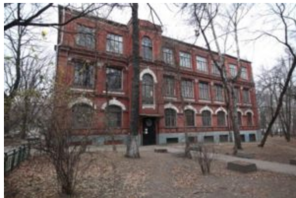
Приют прекратил своё существование 100 лет тому назад