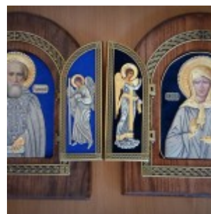
Иконы преподобного Сергия Радонежского и блаженной Матроны Московской