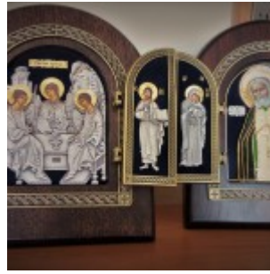
Иконы Живоначальной Троицы и преподобного Серафима, Саровского чудотворца