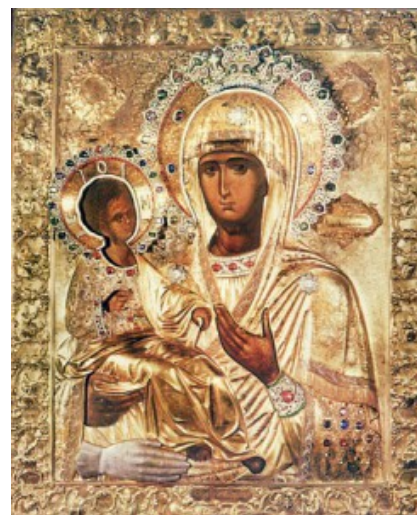
Икона Божией Матери “Троеручица”

Мудрые вдохновенные писания привели в ярость императора; но так как автор их не был византийским подданным и сам император не мог ему ничего сделать, он передал Дамасскому халифу подложное письмо, по которому преподобный Иоанн (бывший министром и градоправителем) был осужден за измену. Святому отрубили кисть правой руки и повесили ее на городской площади. К вечеру того же дня св. Иоанн, испросив у халифа отрубленную кисть, приложил ее к суставу и пал ниц перед иконой Божией Матери. Он просил Владычицу исцелить руку, писавшую в защиту Православия. После долгой молитвы св. Иоанн задремал. Во сне он увидел икону Божией Матери и услышал Ее голос, сказавший что он исцелен, но должен теперь без устали трудиться исцеленной рукой. Когда святой проснулся, рука его была невредима. В благодарность за чудо св. Иоанн приложил к иконе сделанную из серебра руку, отчего она и стала называться «Троеручицей», а также написал благодарственную песнь «О Тебе радуется, Благодатная, всякая тварь».