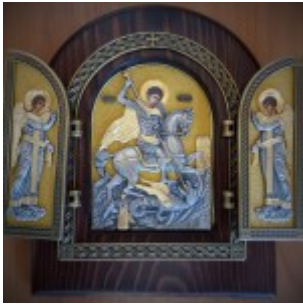
Икона великомученика Георгия Победоносца