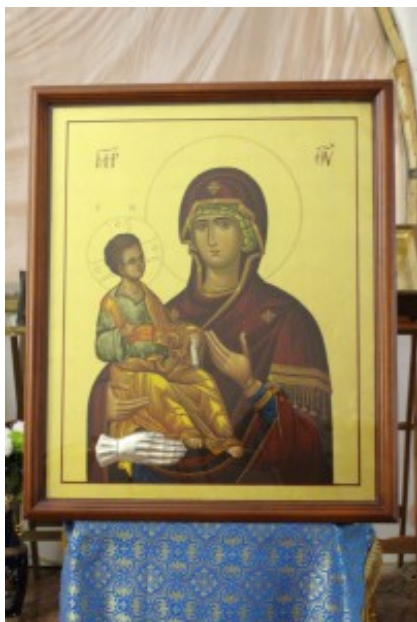
Троеручица, икона Божией Матери