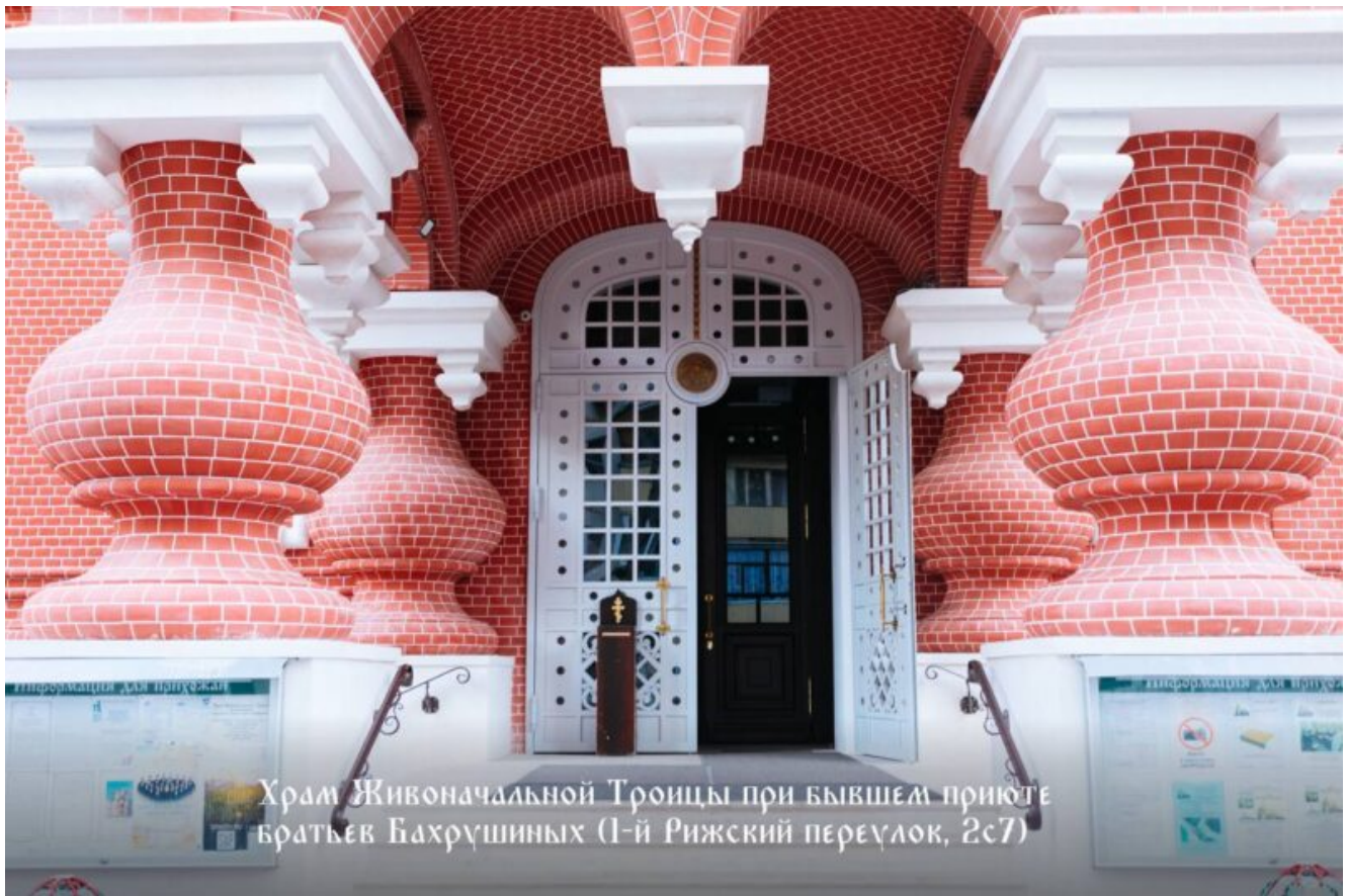
Храм Живоначальной Троицы при бывшем приюте братьев Бахрушиных (1-й Рижский переулок, 2с7)

Специалисты расчистили кирпичные фасады от слоев краски, обработали их поверхность специальными составами, защищающими от плесени и грибка, восстановили кирпичную кладку и укрепили поврежденные швы. Затем были отреставрированы белокаменный и кирпичный декор стен и обрамление оконных проемов. Утраченные архитектурные элементы реставраторы воссоздали по архивным фотографиям. Отремонтировали также три крыльца храма: центральное, южное и северное. На западном, южном и северном фасадах заменили входные двери. На их месте установили новые двери из дерева с крупными металлическими петлями и ручками-кольцами. Кроме того, на крыше заменили металлическое покрытие.