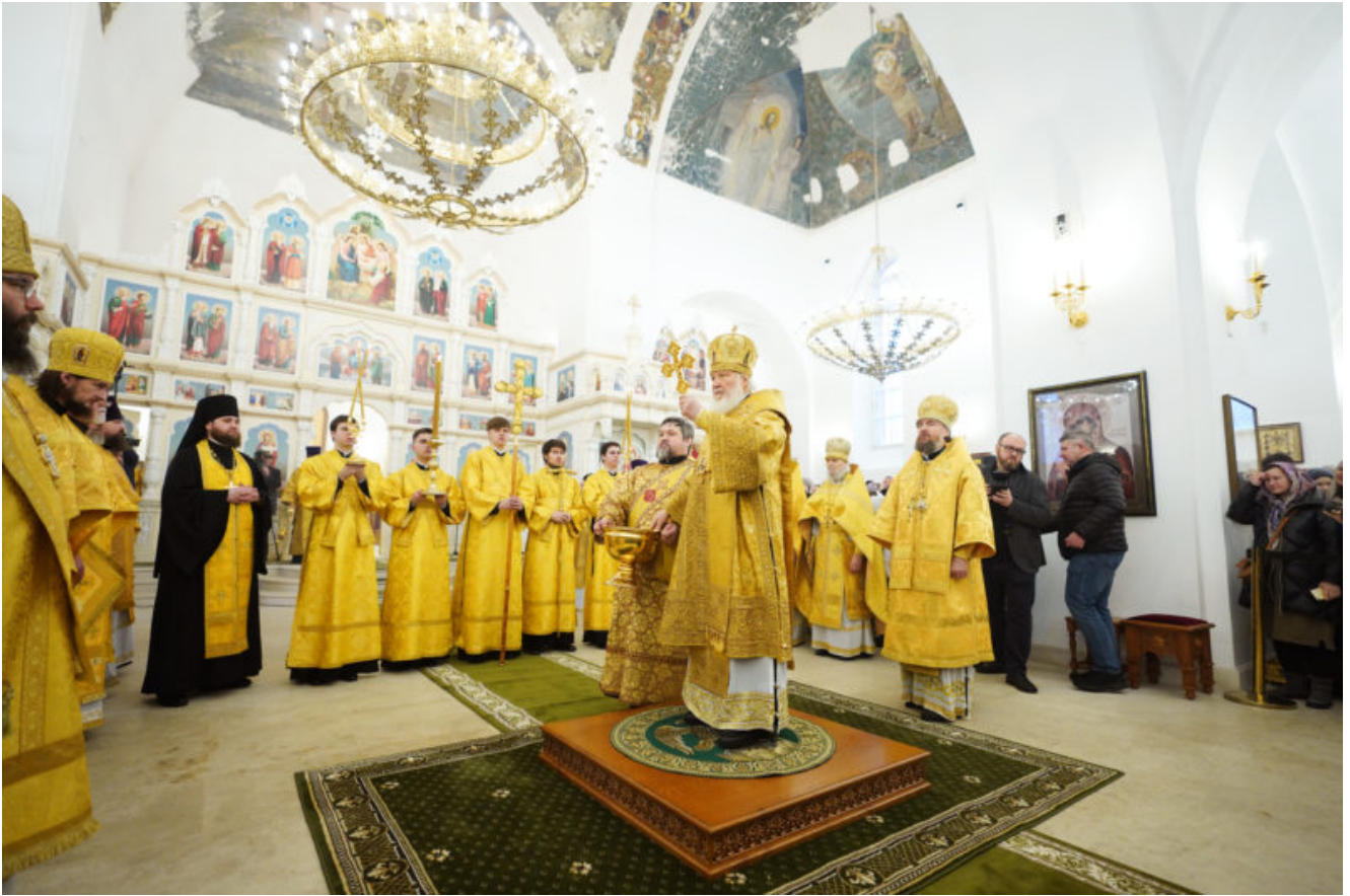
Великое освящение Троицкого храма при бывшем приюте Бахрушиных