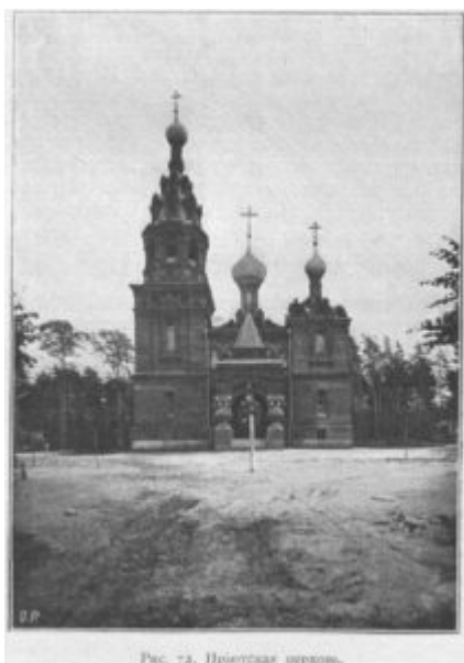
Рис. 74. Троицкий храм.

31 мая в храме Живоначальной Троицы при бывшем приюте Бахрушиных был отслужен молебен по случаю празднования 119-ой годовщины освящения храма.