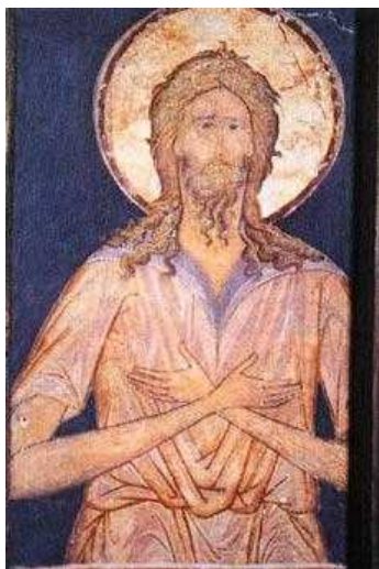
Преподобный Алексий, человек Божий. Фреска Успенского собора Московского Кремля. Кон. XV в.

Алексий, человек Божий (ок. 411), преподобный.