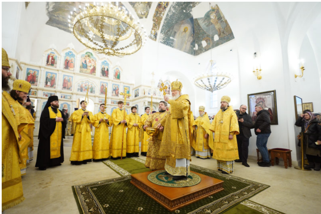
Великое освящение Троицкого храма при бывшем приюте Бахрушиных