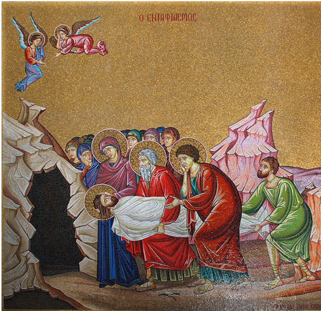
Положение во гроб. Мозаика храма Воскресения Христова в Иерусалиме.

Все дни превосходит святая Четыредесятница, но больше Четыредесятницы святая и Великая Седмица (Страстная) и больше самой седмицы Страстной есть Великая и святая Суббота. Ибо как в первом миротворении Бог, создав все твари и в шестой день окончательно сотворив человека, в седьмой день почил от всех дел Своих, и освятил его, наименовав субботою, то есть покоем: так и в делании умного творения, совершив все (дело искупления), и в шестой день – пяток, паки возсоздавши истлевшего грехом человека и обновив его живоносным крестом и смертью, в настоящий седьмой день Господь успокоился, уснув животоестественным и спасительным сном. Бог Слово плотию снисходит во гроб, снисходит же и во ад (1 Петр. 3, 19-20) с естественною и Божественною душою, через смерть отделившуюся