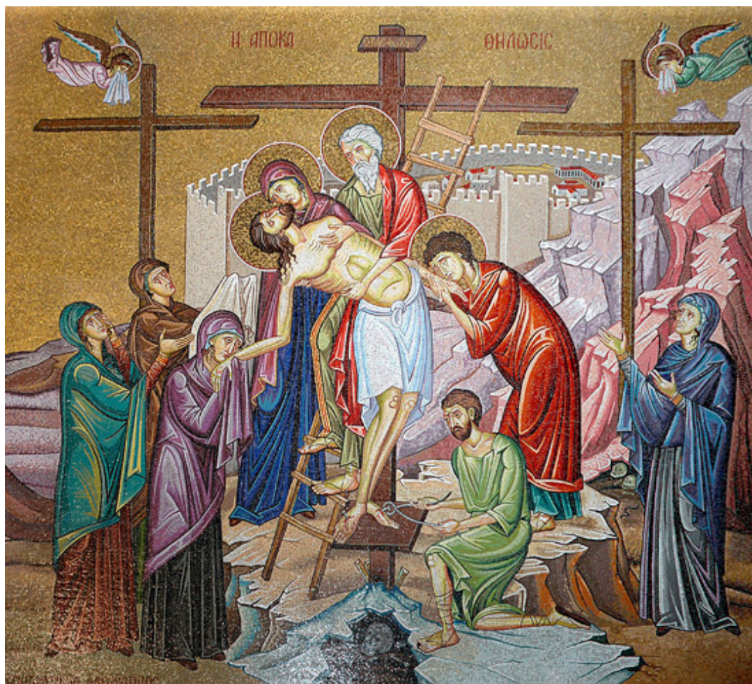
Снятие с креста. Мозаика храма Воскресения Христова в Иерусалиме.

В Великую субботу Православная Церковь вспоминает телесное погребение Иисуса Христа и сошествие Его во ад.