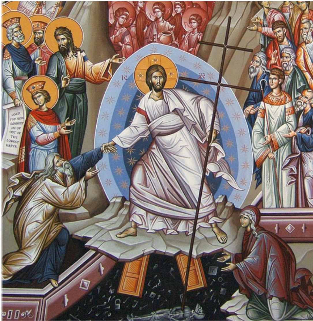
Сошествие во ад

На утрени Великой Субботы, после Великого славословия, Плащаница при пении «Святой Боже...» выносится священнослужителями из храма на главе, при участии народа, и обносится вокруг храма в воспоминание сошествия Иисуса Христа во ад и победы Его над адом и смертью. Затем, по внесению Плащаницы во храм, она подносится к открытым Царским Вратам, в знамение того, что Спаситель неразлучно пребывает с Богом Отцом и что Он Своими страданиями и смертью снова отверз нам двери рая.