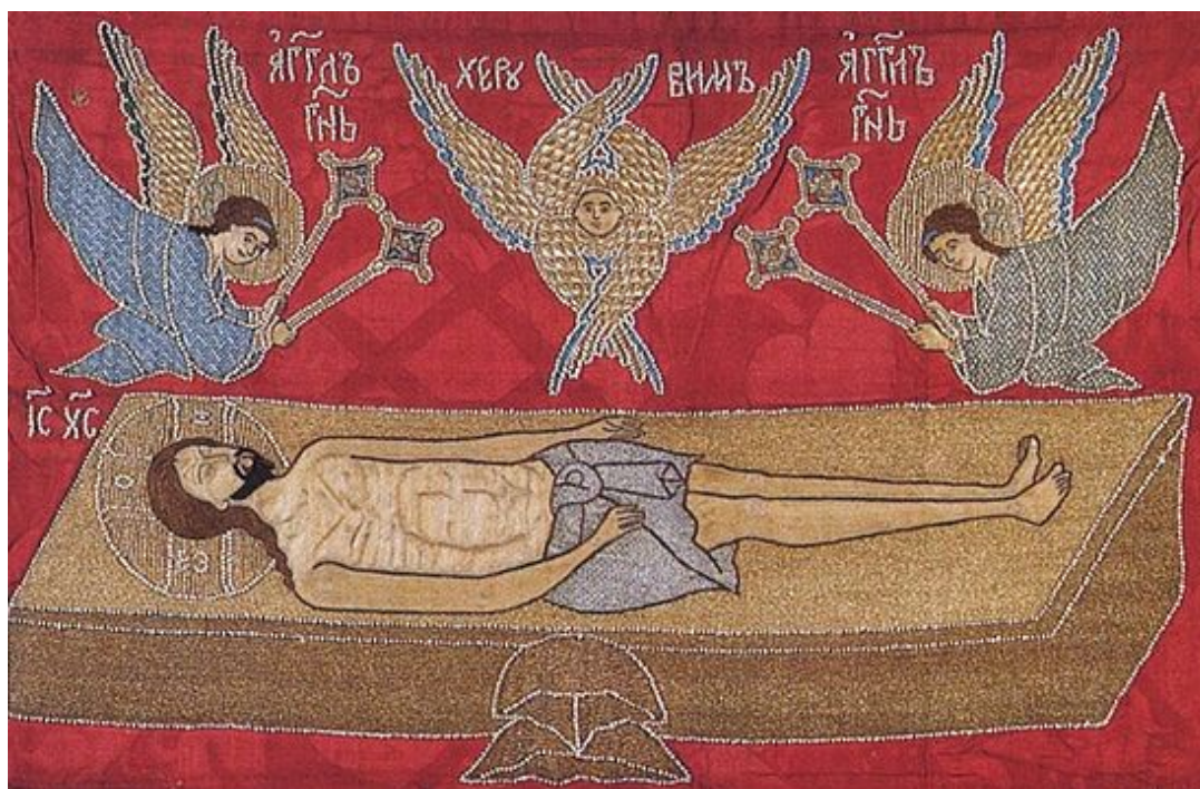
Христос во гробе

Конечно, здесь разумеется смерть не телесная, ибо Апостол употребил слово умерли в отношении к людям живым, а смерть для мира, то есть для страстей. Об этом тот же Апостол говорит в послании к Галатам: те, которые Христовы, распяли плоть со страстями и похотями (Гал. 5, 24). Ясно отсюда, что мы умрем со Христом только в том случае, если умертвим свои страсти чревоугодия, блуда, сребролюбия, гнева, печали, уныния, тщеславия и гордости. А умерщвление страстей есть подвиг, который можно назвать добровольным мученичеством. Так учил и святой Феодор Студит, говоря, что иноки каждый день умирают через отсечение своей страстной, греховной воли. Поэтому они наследуют мученические венцы, как и святые мученики.