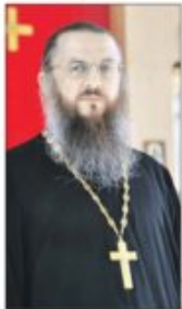
Старших селили с младшими