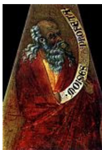
Святой пророк Моисей

Святая Елисавета зачала и, боясь насмешек над поздней беременностью, таилась пять месяцев, пока ее не посетила приходившаяся ей дальней родственницей Преподобная Дева Мария, чтобы разделить Свою и ее радость. Елисавета, исполнившись Святого Духа, первая приветствовала Деву Марию как Матерь Божию. Вместе с ней Пресвятую Деву Марию и воплотившегося в Ней Сына Божия приветствовал “играньми, яко песньми” и святой Иоанн, еще находившийся в утробе матери своей, праведной Елисаветы.