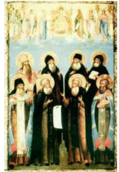
Собор Радонежских святых

собеседников преподобного Сергия Радонежского, а также святых иноков Троице-Сергиевой обители.