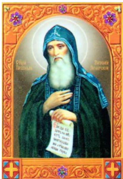
Преподобный Антоний Киево-Печерский

Преподобный Антоний Киево-Печерский родился в 983 году недалеко от Чернигова, в местечке Любече. С юных лет имея страх Божий, он желал облечься в иноческий образ. Придя в возраст, он отправился странствовать и, достигнув Афона, возгорелся желанием подражать подвигам его святых насельников. Приняв здесь постриг, юный инок во всем благоугождал Богу и, подвизаясь на пути добродетели, особенно преуспевал в покорности и послушании, так что все монахи радовались, глядя на его святую жизнь.