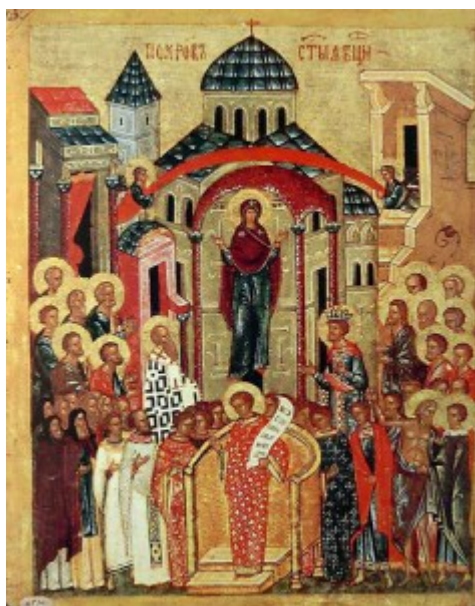
Покров Пресвятой Богородицы

“Дева днесь предстоит в Церкви, и с лики святых невидимо за ны молится Богу: ангели со архиереи покланяются, апостоли же со пророки ликовствуют: нас бо ради молит Богородица Превечнаго Бога” – это чудное явление Матери Божией произошло в середине X века в Константинополе, во Влахернской церкви, где хранилась риза Богоматери, Ее головной покров (мафорий) и часть пояса, перенесенные из Палестины в V веке. В воскресный день, 1