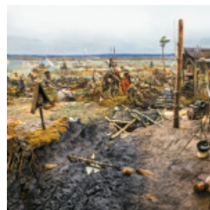
Музей- диорама “Великое Стояние на реке Угре”