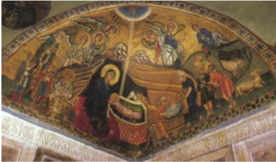
Мозаика собора монастыря Осиос Лукас в Фокиде (Греция), XI в.

Именно сорок дней в Священном Писании всегда предшествуют большим событиям: посты пророков Моисея и Илии или сорокадневное воздержание от пищи Самого Спасителя Иисуса Христа перед выходом на проповедь. То есть сам пост подчеркивает значимость события, а сорок дней отмечают особое приготовления к ней.