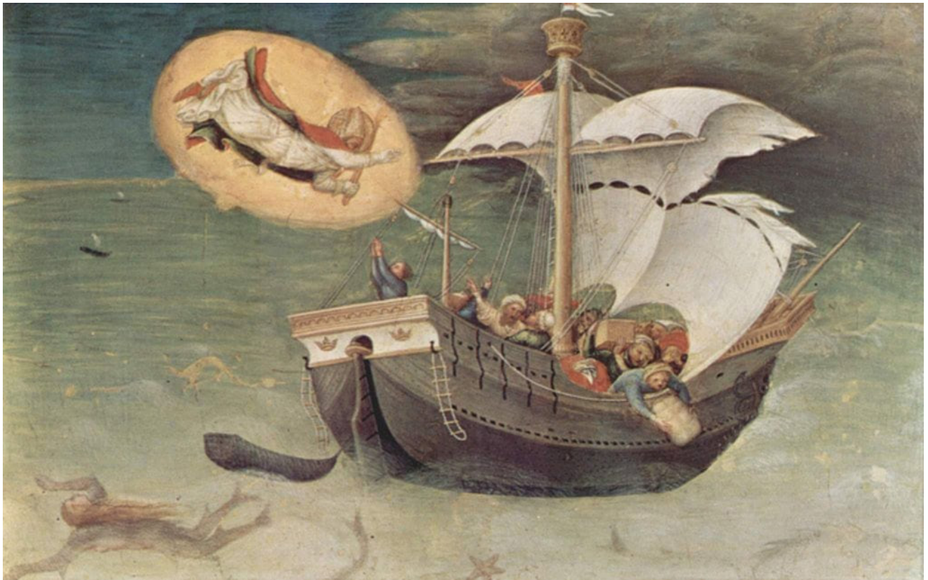
Джентиле да Фабриано. Спасение моряков. Ок. 1425

История о помощи святителя Николая морякам во время шторма в житии повторяется дважды. Второй раз в повествовании говорится о моряках, которые из Египта направлялись в Ликию и также попали в бурю. Зная о прославленном архиерее и не надеясь на спасение, они мысленно призвали святителя Николая молиться о них. Случилось чудо. Вдруг у корабельного руля все увидели святителя Николая, который управлял судном. Именно его несколькими днями позже моряки узнали в архиерее в церкви города Миры, куда причалил корабль.