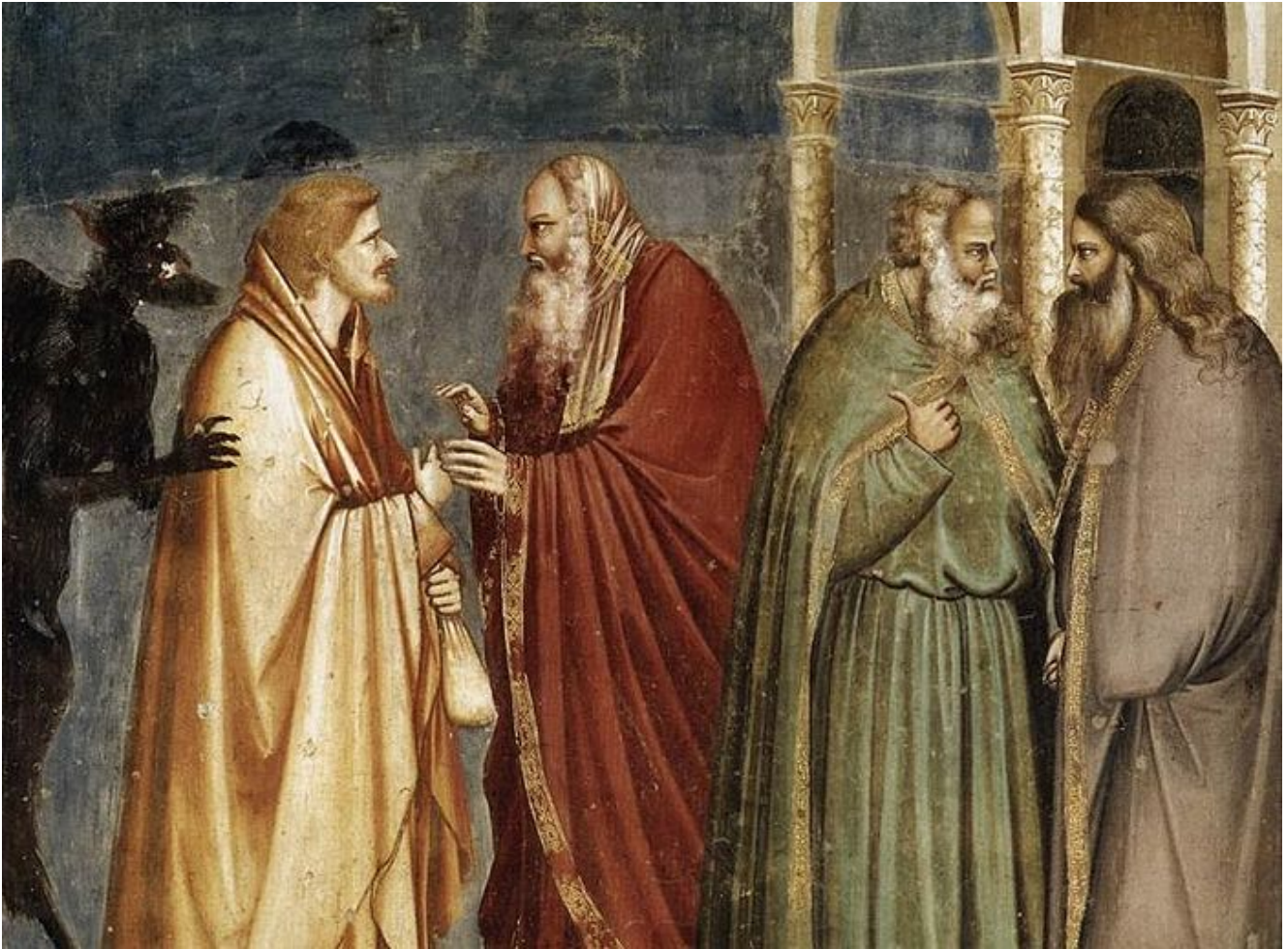
Джотто ди Бондоне. Предательство Иуды

В ночь на среду Господь провел в Вифании. Здесь, в доме Симона прокаженного, в то время, когда в совете первосвященников, книжников и старейшин было уже решено взять Иисуса Христа хитростью и убить Его, некая жена «грешница» возлила драгоценное миро на главу Спасителя и тем уготовала Его на погребение, как судил Сам Он об ее поступке. Здесь же, в противоположность бескорыстному поступку жены грешницы, родилось в неблагодарной душе Иуды, одного из двенадцати учеников Спасителя, преступное намерение предать незаконному совету своего Учителя и Господа. Поэтому в церковной службе Великой среды прославляется жена грешница и порицается и проклинается сребролюбие и предательство Иуды.