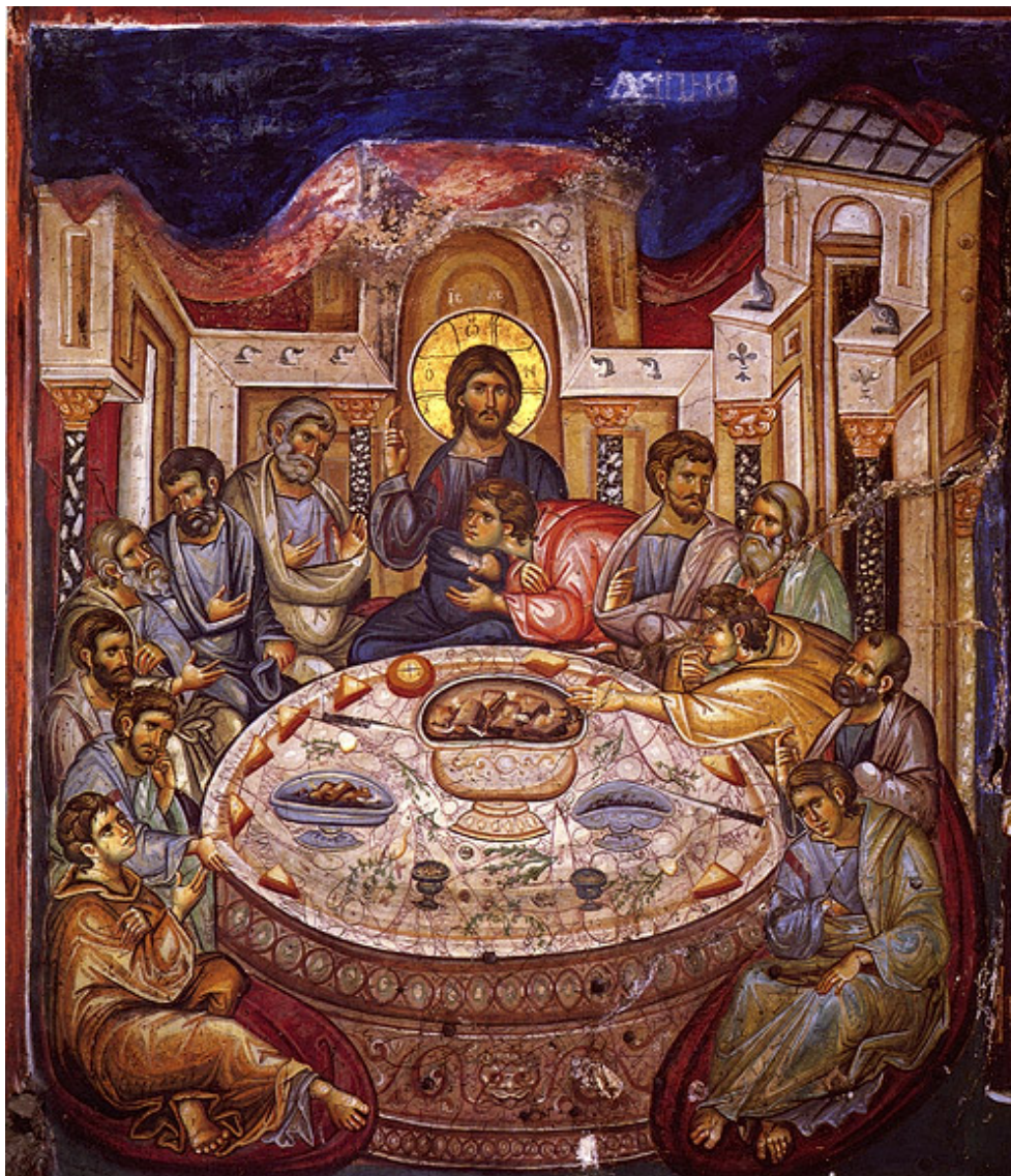
Тайная вечеря. Фреска 1312 г. Кафоликон Ватопедского монастыря. Афон

В день опресноков, когда по ветхозаветному закону должно было заклать и вкушать пасхального агнца, и когда прииде час, да преидет Спаситель от мира сего к Отцу (Ин. 13, 1), Иисус Христос, пришедший исполнить закон, послал Своих учеников – Петра и Иоанна в Иерусалим приготовить Пасху, которую, как сень законную, хотел Он заменить Пасхою новою, – самим телом и кровью Своею. По наступлении вечера Господь пришел с двенадцатью Своими учениками в большую, устланную, готовую горницу одного Иерусалимлянина (Мк. 14, 12-17) и возлег. Внушая, что в Царстве Божием, которое не от мира сего, не земное величие и слава, но любовь, смирение и чистота духа отличают истинных членов, Господь, возстав от вечери, умыл