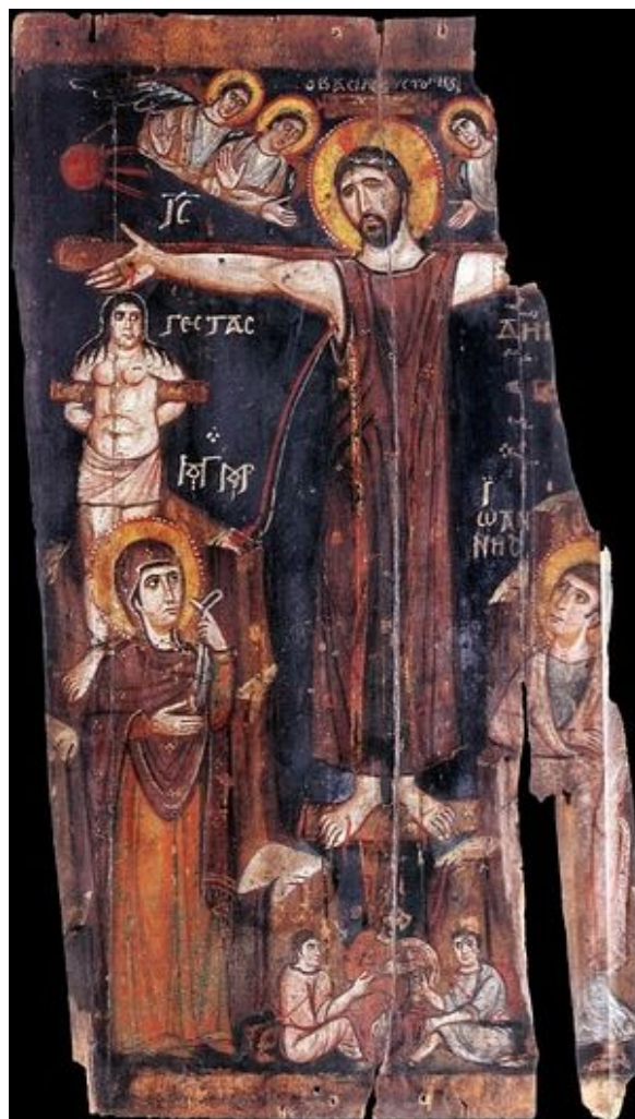
Великая Пятница. Распятие, VIII в, Синай

Какое то было зрелище, которое приводило зрителей в совершенное недоумение? Какое было то зрелище, которое запечатлевало уста зрителей молчанием, и вместе потрясало души их? Приходили они на зрелище, чтоб удовлетворить любопытству; уходили со зрелища, ударяя в грудь и унося с собою страшное недоумение... Какое было это зрелище?