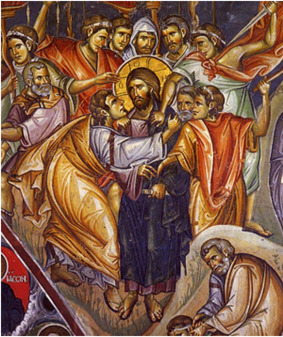
Поцелуй Иуды. Фреска 1312 г. Кафоликон Ватопедского монастыря. Афон

Как многие ныне говорят: желал бы я видеть лицо Христа, образ, одежду! Вот, ты видишь Его, прикасаешься к Нему, вкушаешь Его. Ты желаешь видеть одежды Его, а Он дает тебе самого Себя и не только видеть, но и касаться, и вкушать, и принимать внутрь. Итак, никто не должен приступать с пренебрежением, никто с малодушием, но все с пламенной любовью, все с горячим сердцем и бодростью. Если иудеи ели агнца с поспешностью, стоя и имея сапоги на ногах и жезлы в руках, то гораздо более тебе должно бодрствовать. Они готовились идти в Палестину, ты же готовишься идти на небо. Поэтому должно всегда бодрствовать, — немалое предстоит наказание тем, которые недостойно приобщаются. Подумай, как ты негодуешь на предателя и на тех, которые распяли Христа. Итак, берегись, чтоб и тебе не сделаться виновным против тела и крови Христовой. Они убили всесвятое тело; и ты принимаешь его нечистой душой после столь великих благодеяний. Во самом деле, Он не удовольствовался лишь тем, что сделался человеком, был заушен и умерщвлен; но Он еще сообщает Себя нам, и не только верою, но и самим делом делает нас Своим телом. Насколько же чист должен быть тот, кто наслаждается безкровною жертвою?