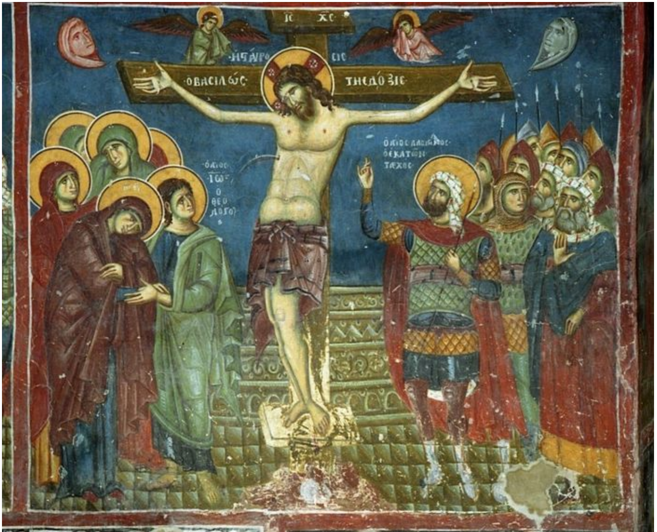
Великая Пятница. Распятие. Фреска церкви св.Николая в Прилепе, Македония. XII-XIII в.

Совершая в Великую пятницу «последование святых и спасительных страстей Господа нашего Иисуса Христа», Православная Церковь в этот великий день все времена священных событий спасения мира ознаменовала богослужением: время взятия Спасителя в саду Гефсиманском и осуждения Его архиереями и старейшинами на страдания и смерть (Мф. 27, 1) – богослужением утрени; время ведения Спасителя на суд к Пилату – Богослужением первого часа (Мф. 27, 2); время осуждения Господа на суде у Пилата – совершением третьего часа; время крестных страданий Христа – шестым часом; время смерти – девятым часом; а снятие тела Христова со креста вечернею.