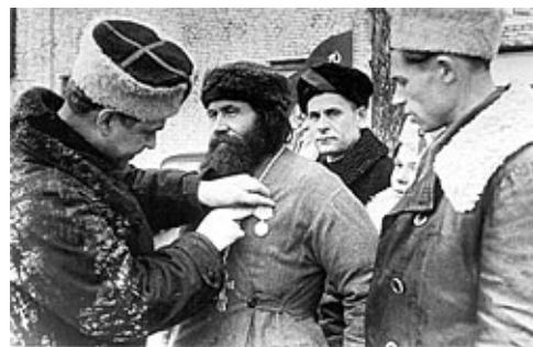
Командир 5 - й Ленинградской

Это была война с половиной объединенной Европы. Очевидно, что русский народ победил не потому, что ему помогали союзники. Если посмотреть на масштабы противостояния, на то, какая махина двинулась на нас, то, конечно, все преимущества были на стороне противника, чтобы там ни писали об изготовлении советской техники. Германия аккумулировала все возможные материальные ресурсы Европы, на ее стороне были не только технические преимущества, но и дисциплинарные. Германцы – народ организованный, готовый на большие лишения. Это – народ идейный, выразитель устремлений настоящей объединенной Европы, имеющей национальное содержание, пусть и безрелигиозное, но все-таки национальное. Они сумели организовать техническую мощь практически всей Западной Европы на войну с Россией.