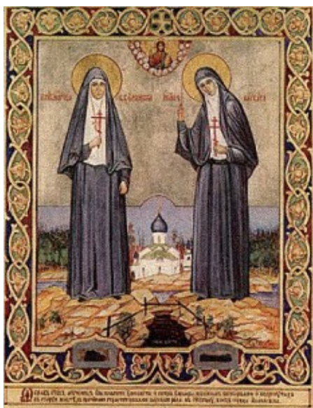
Преподобномученицы Варвара и Елисавета Алапаевские

Преподобномученица Великая княгиня Елисавета родилась 20 октября 1864 года в протестантской семье Великого герцога