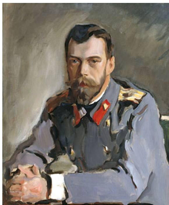
Валентин Серов. Портрет Императора Николая II. 1900 г.

Временное правительство объявило об аресте Императора Николая II и его Августейшей супруги и содержании их в Царском Селе. Арест Императора и Императрицы не имел ни малейшего законного основания или повода.