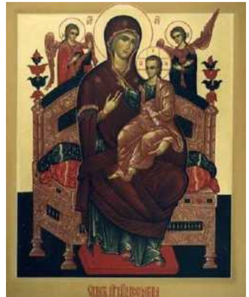
Симонопетрский образ Богородицы Всецарицы

Известна икона Богородицы “Всецарицы” (Пантанассы) подаренная супругой святого Молдавского господаря Стефана Великого царевной Марией Палеологиной (Мангупской) монастырю Григориат на Святой Горе Афон. Образ этот оказался в Григориате в XV веке и в дальнейшем оставался невредимым при всех случавшихся там пожарах, даже тогда, когда все остальное сгорало дотла.