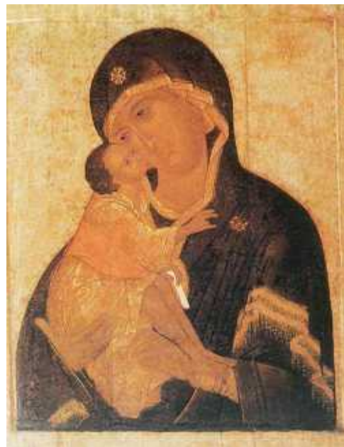
Донская икона Божией Матери

Икона 2-сторонняя (размер 86×68 см): на лицевой стороне – образ Богоматери с Младенцем, на обороте – Успение Пресвятой Богородицы. В нижней части иконной доски находится углубление для святых мощей, закрытое воском после реставрации.