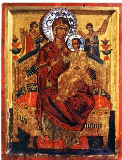
Ватопедский образ Богородицы Всецарицы

Икона изображает Пресвятую Богородицу со Своим Божественным Сыном, восседающую на престоле, с двумя ангелами за Ней.