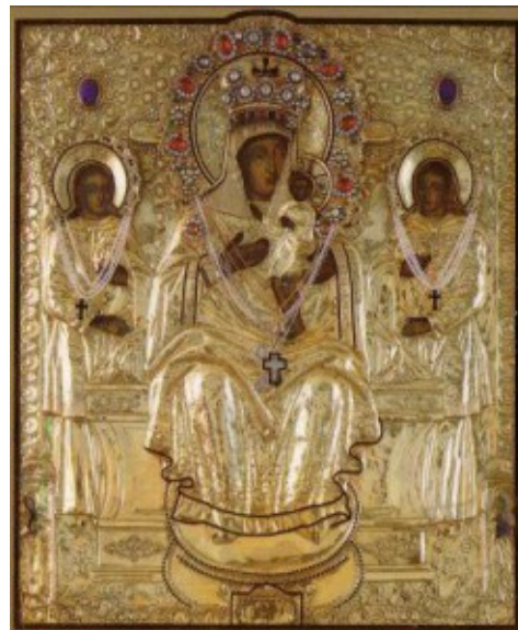
Кипрская икона Божией Матери в селе Стромьни