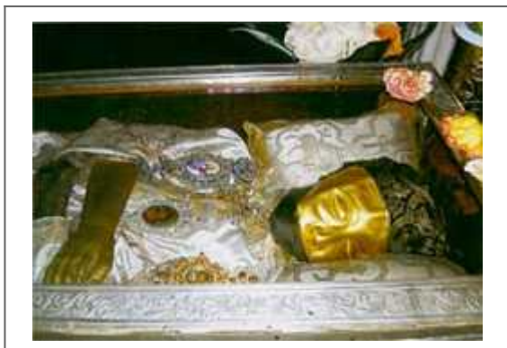
Честные мощи святого праведника Иоанна Русского, остров Эвбея.

святого стали почитать не только православные христиане, но и армяне, и турки, обращаясь с молитвенным прошением к русскому святому: “Раб Божий, не обойди нас своей милостью”.