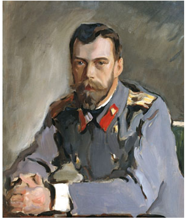
Валентин Серов. Портрет Императора Николая II. 1900 г.